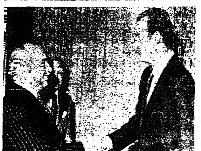
الوزير فهمي أثناء لقائه مع الخرجان كارولوس (صورة بالترتيب من اليمين)

أنهى السيد اسماعيل فهمي وزير الخارجية المصري زيارته لاسباينا أمس ، وغادر مدريد صباحا الذي استمر في طريق جنيف . وكان في وداعه في المطار وزير الخارجية الإسباني بيدرو كورتينا ، وكبار المسؤولين في وزارة الخارجية الإسبانية والسفير المصري حسن سري عصمت وأعضاء السفارة ، وسلمى الدروبي مدير مكتب الجامعة العربية . وقالت مصادر مطلعة في مدريد أن بيدرو كورتينا وزير خارجية اسباينا أبلغ السيد فهمي خلال زيارته التي استغرقت ثلاثة أيام أن اسباينا مستسحب من الصراع في أسرع وقت يمكن وفقا لرغبات سكانها . وقال وزير خارجية اسباينا في حديث له مع الصحافة المصرية إن قرار الرئيس أنور السادات فتح قناة السويس كان قرارا حاسما وجريئا ودعيا لحالات السلام في المنطقة . وأضاف قائلا أنه على غير من الأمل أن تصل منطقة الشرق الأوسط إلى حل سلمي ، وأنه يبعث مع السيد اسماعيل فهمي وزير الخارجية المصري بالتحية والمحاورات الجيدة بالتفصيل . وقال وزير الخارجية الإسباني أن موقف اسباينا إزاء النزاع العربي الإسرائيلي هو موقف ثابت ودائم لا يدخل عليه أي تغير أو تعديل .. فاسبانيا وقت مع لدى العربي دون أي تردد دائما بتطبيق قرارات هيئة بالكمال . وقال كورتينا أن الحكومة الإسبانية